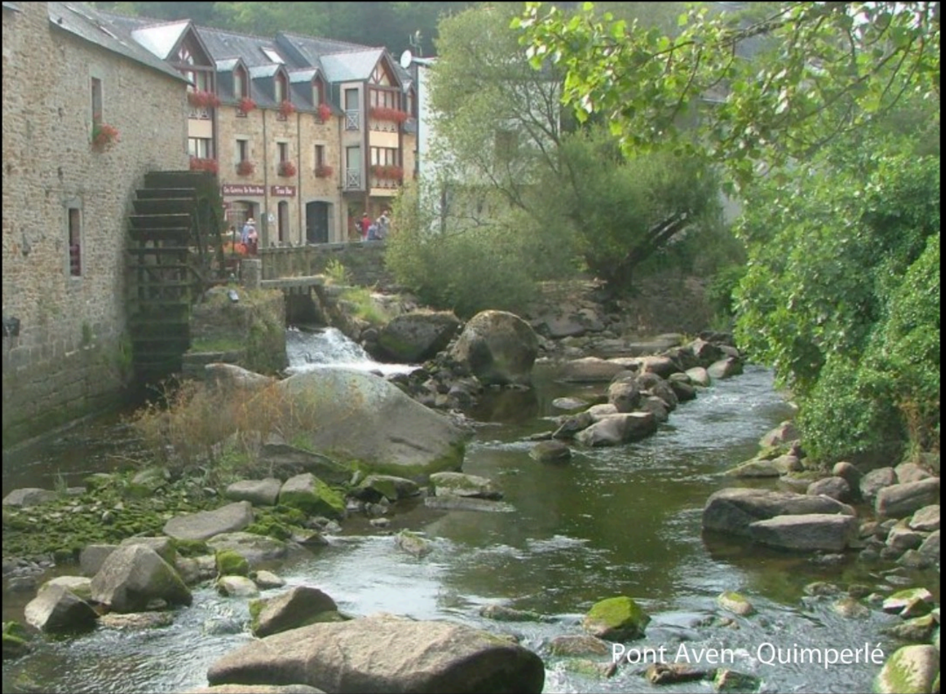
Pont Aven - Quimperlé