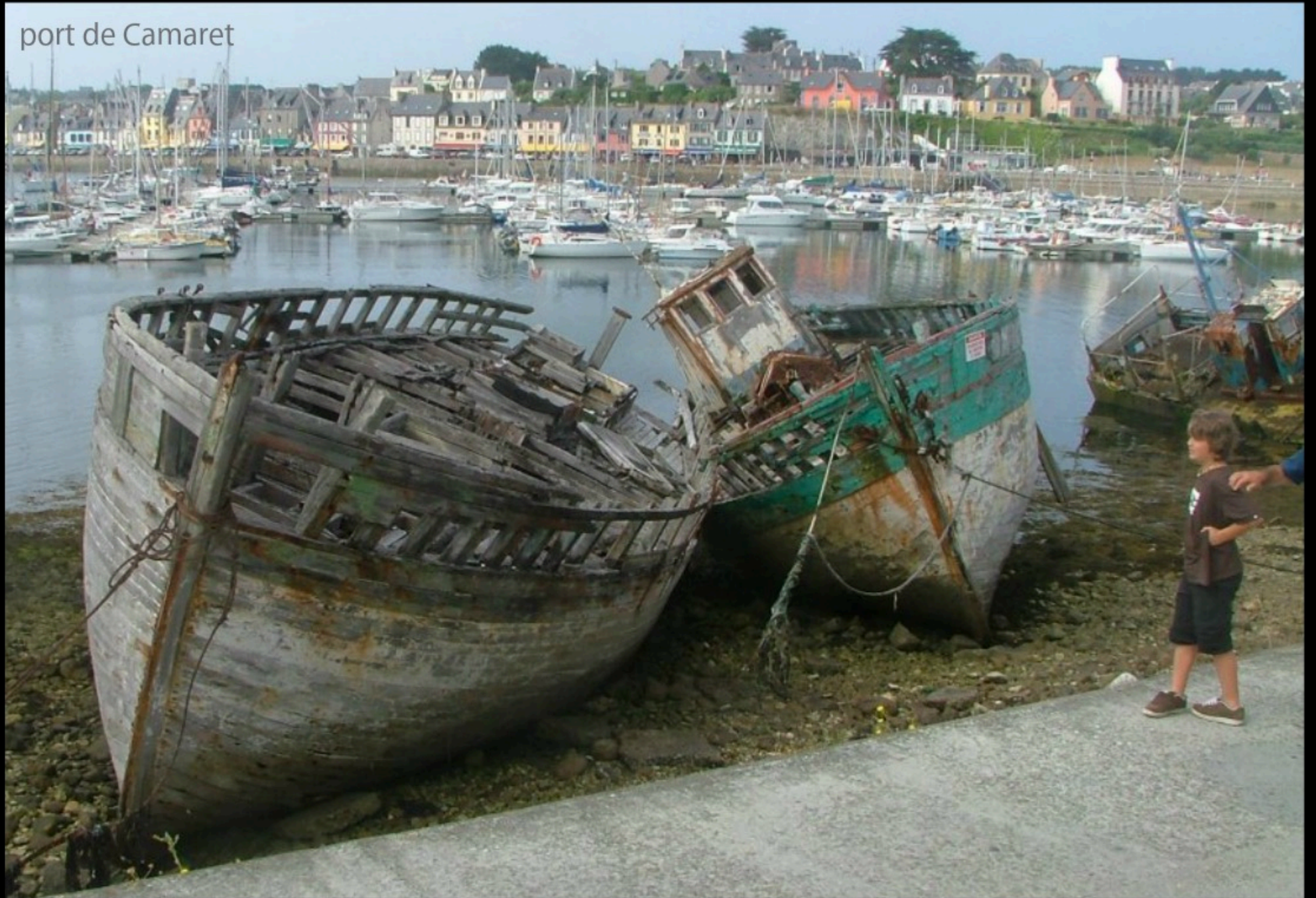
port de Camaret